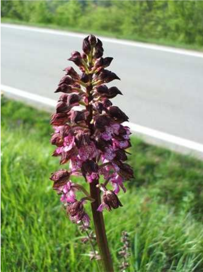
Figura 4 – Spiga dell'esemplare di Fig. 3.