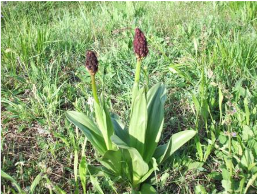
Figura 5 – Due esemplari osservati in boccio.