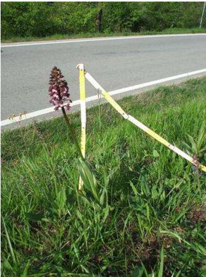
Figura 3 – Esemplare di Orchis purpurea Huds. ad inizio fioritura.