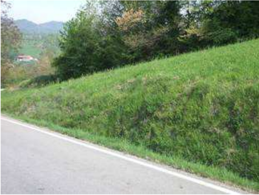
Figura 2 – Prato stabile in cui sono stati osservati i 18 esemplari in scheda.