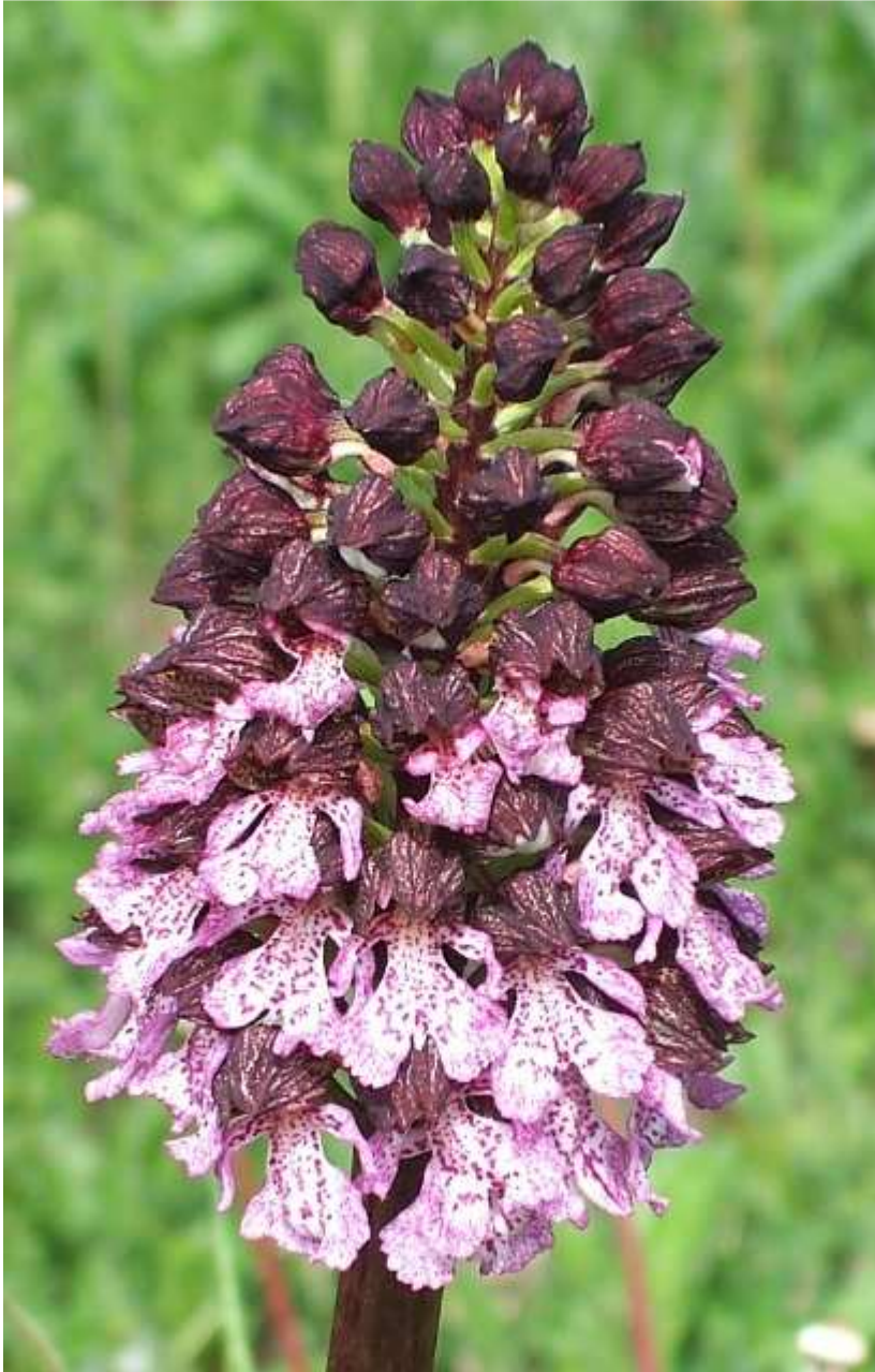
Figura 3 – Particolare dell'infiorescenza di uno dei tre esemplari osservati di Orchis purpurea Huds. ad inizio fioritura (quello in secondo piano in figura 2).