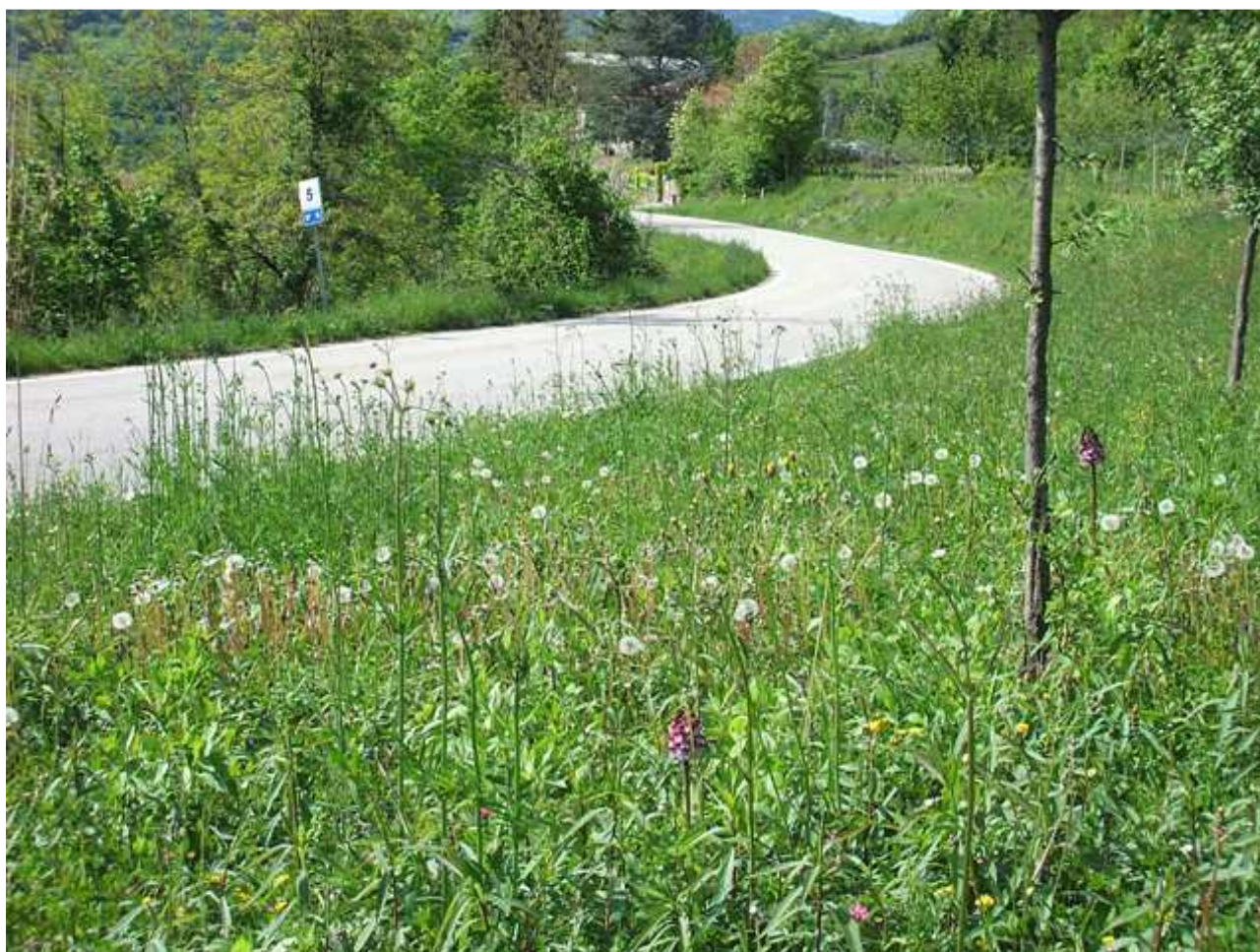
Figura 2 – Appezzamento a prato stabile in cui sono stati osservate 3 Orchis purpurea Huds., tutte allo stadio fenologico di inizio fioritura. In figura sono visibili due dei tre esemplari.